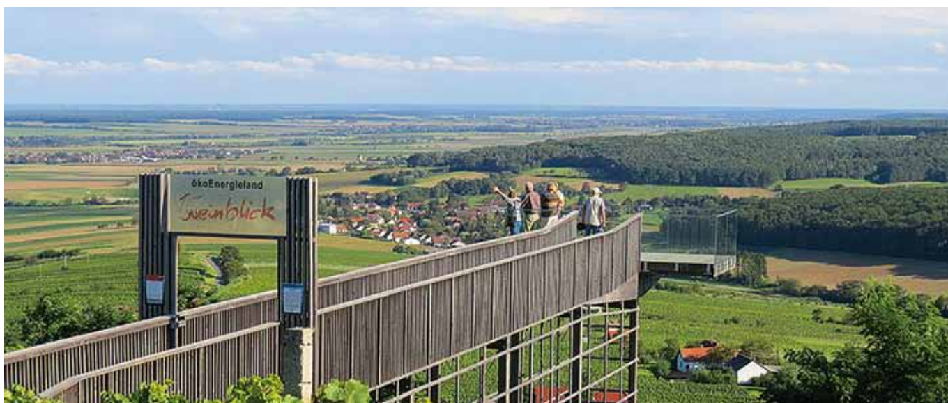
■ Der Weinblick – eine touristische Attraktion im südburgenländischen ökoEnergieLand

Aus den Erfahrungen im Energieeffizienzbereich im öffentlichen Sektor lassen sich noch weitere Potentiale zur Effizienzsteigerung und Energieeinsparung vermuten. Daher werden in der Weiterführung bestimmte Bereiche näher