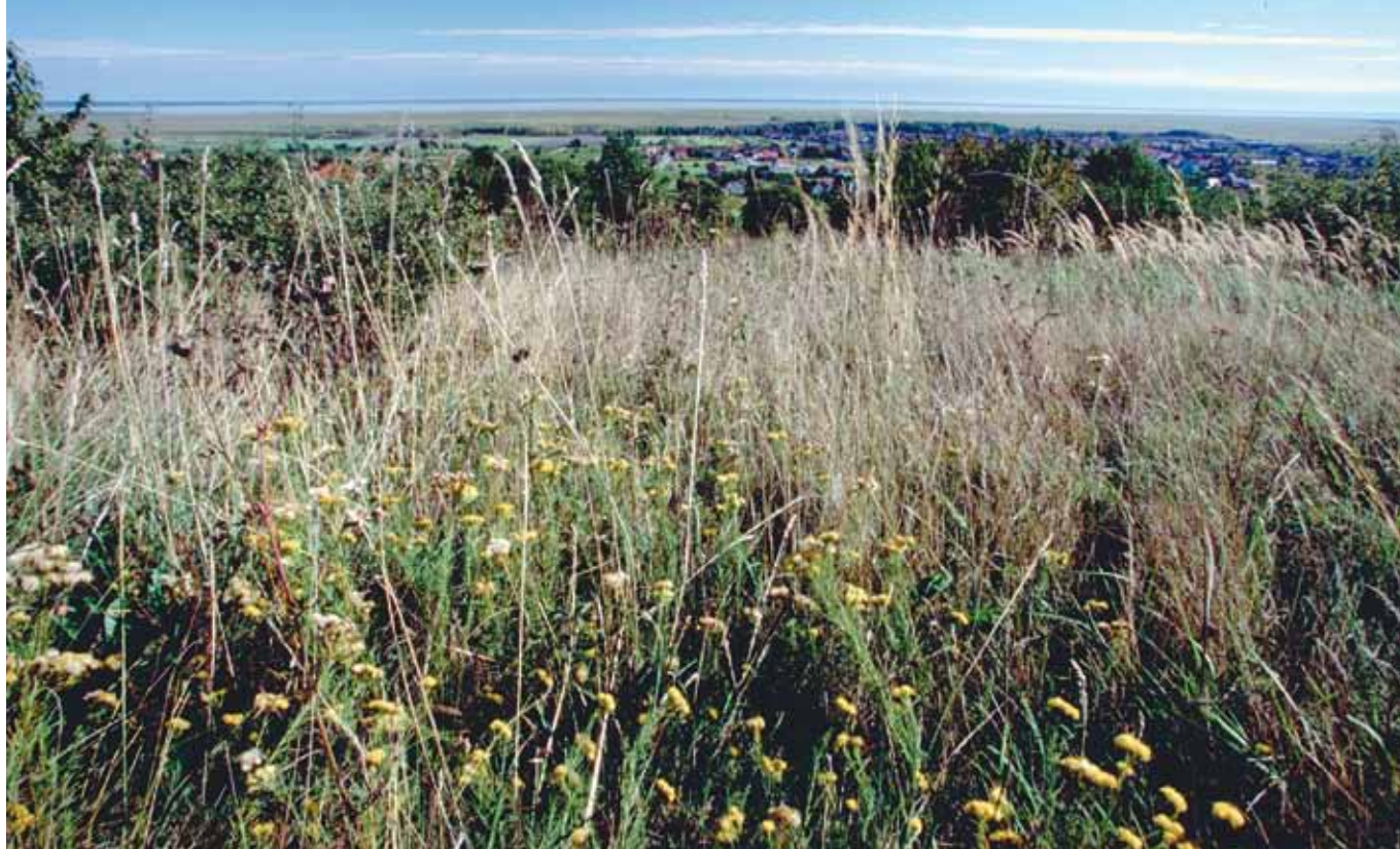
■ Findet bei der Exkursion im Rahmen der heurigen Pannonischen Natur.Erlebnis.Tage quasi „nebenbei“ Beachtung: wertvoller Trockenrasen im Welterbe-Naturpark Neusiedler See – Leithagebirge

Skulpturenpark von Prof. Wander Bertoni. Am beeindruckenden Aussichtspunkt erhalten die Teilnehmer einen Überblick über das Welterbegebiet, die Besonderheiten und Schätze der Region und was diese zum UNESCO-Welterbe macht. Die Wanderung führt durch die einzigartige Kulturlandschaft entlang des Leithagebirges zurück nach Winden. Bei Interesse an diesen beiden Exkursionen bitte gleich unter nachstehendem Link anmelden: