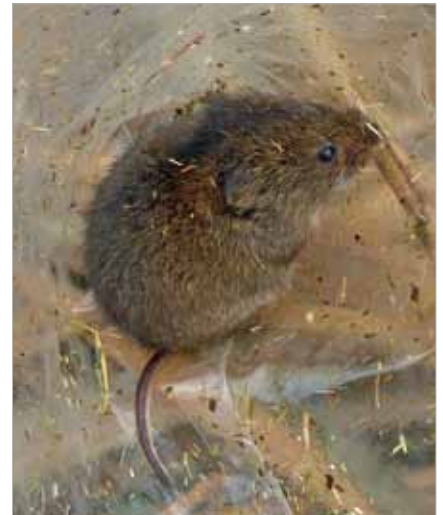
■ Gefangene Sumpfwühlmaus