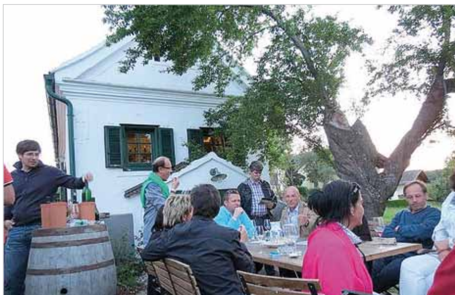
■ Weinfrühling im Südburgenland