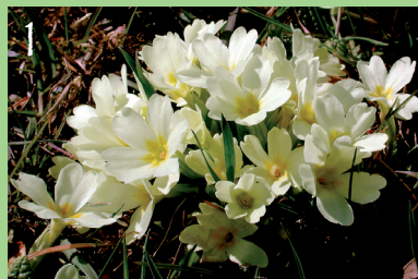
Waldboden mit Erd-Primel

Grenzüberschreitende Zusammenarbeit zu fördern und Naturschutz als Chance für die gemeinsame Regionalentwicklung zu positionieren, ist das Ziel der Initiative „Grünes Band Europa“.