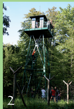
Stockwerke des Waldes Alter Wachturm