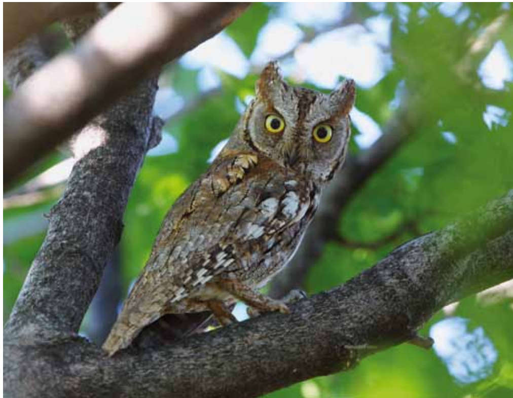
■ Das Artenschutzprogramm für die Zwergohreule im Mattersburger Hügelland gibt Aufschluss über die Lebensweise dieser geschützten Art.

Ein Ungleichgewicht in unseren heimischen Ökosystemen kann durch nicht autochthone Arten entstehen, die ungewollt