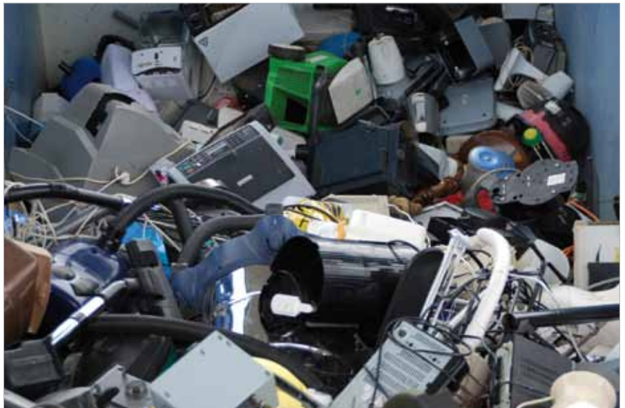
■ Elektrogeräte sind ordnungsgemäß via Sammelstelle zu entsorgen.

... so das Ergebnis einer repräsentativen market-Umfrage, die im Auftrag der Elektroaltgeräte-Koordinierungsstelle (EAK) durchgeführt wurde. Demnach bezeichnen 79 Prozent der Burgenländerinnen und Burgenländer das Thema Elektroaltgeräte- und Altbatterieentsorgung als sehr wichtig oder wichtig. 88 Prozent der Befragten wissen spontan befragt, dass kaputte Elektrogeräte bei Sammelstellen entsorgt werden können. 95 Prozent wissen genau, wo sich die nächste Sammelstelle, die für