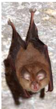
■ Die Kleine Hufeisennase fühlt sich auf Burg Forchtenstein wohl.

DI Andrea GRAFL Esterházy Betriebe A-7000 Eisenstadt Esterházyplatz 5 T +43 (0) 2682 63004 201 www.esterhazy.at