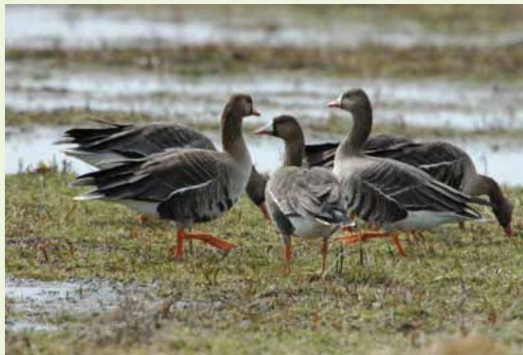
■ Vor der Jahreshauptversammlung steht heuer der Gänsestrich im Seewinkel im Fokus einer Exkursion

Infos und Anmeldung zur Jahreshauptversammlung 2016: www.naturschutzbund-burgenland.at , Sekretariat: 0664 / 8453048, ilse.szolderits@naturschutzbund.at , persönliche Anmeldung aus organisatorischen Gründen erforderlich. Bei Interesse an einer Mitfahrgelegenheit wenden Sie sich bitte ebenfalls an das Sekretariat des Naturschutzbunds Burgenland.