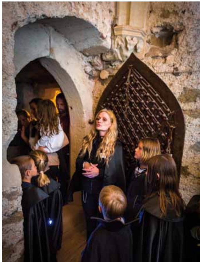
■ Draculade – Mondscheinführung auf Burg Forchtenstein

► Giftfrei: Bei Reinigungsarbeiten werden ausschließlich um-