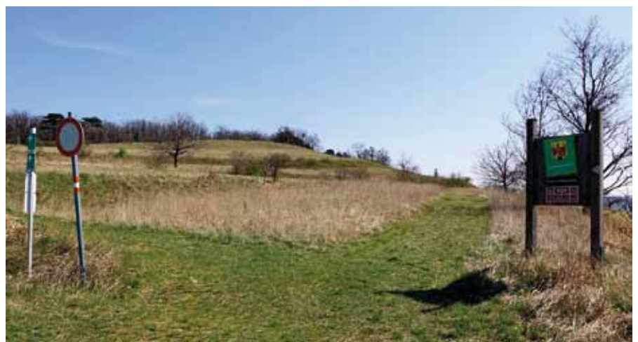
■ links und oben: Seit 55 Jahren kümmern sich Naturschutzorgane um die burgenländischen Schutzgebiete unterschiedlichster Kategorisierungen.