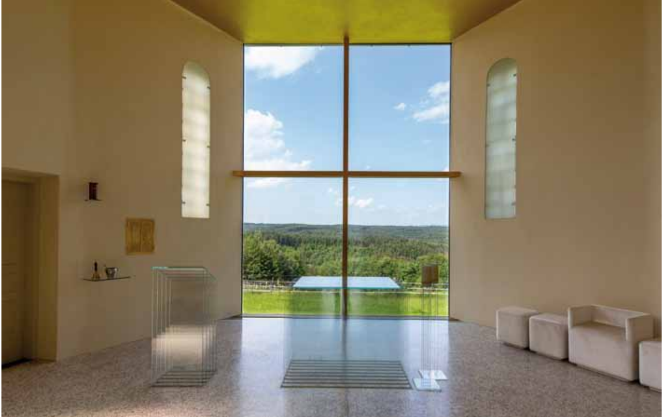
■ Filialkirche von Neuhaus in der Wart, Südburgenland