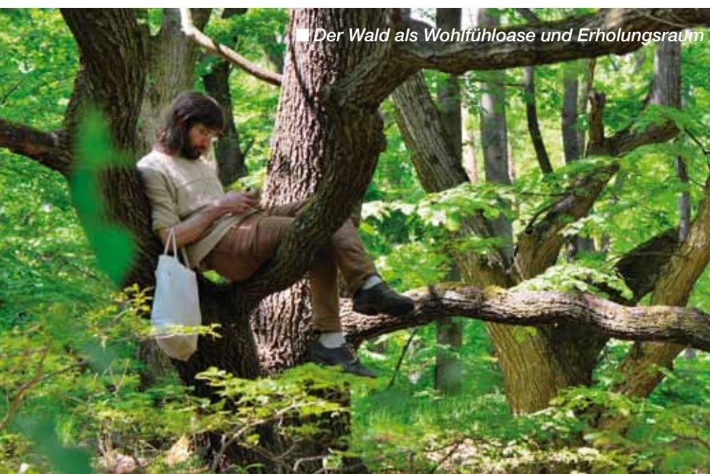
■ Der Wald als Wohlfühloase und Erholungsraum

Eine Möglichkeit (und moralische Verpflichtung) wäre, dass Betriebe/Konzerne, die auf Kosten unserer Umwelt Gewinne erzielen, einen Teil davon für die Erhaltung (Nichtnutzung) unserer Wälder zurückgeben, etwa durch die Einführung der lange diskutierten