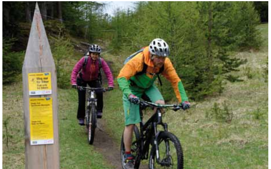
■ Mountainbiker auf gekennzeichneteter Route durch den Bergwald

Das Tourismusland Tirol ist dabei in einer besonderen Situation – 46 Millionen Nächtigungen werden jährlich verzeichnet. Dort besteht daher bereits seit vielen Jahren der politische Wunsch nach integrativen Lösungskonzepten im Wald. Aktuell versuchen Verantwortliche aus Forst, Jagd, Tourismus und Umwelt im Rahmen eines Projekts, die Freizeitsportler aufzuklären und zu lenken. Man bedient sich dafür einer breiten Palette an Kommu-