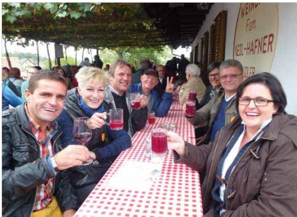
■ Jedes Jahr auf's Neue ein genussvolles Erlebnis: Das Uhdlersturmfest in Heiligenbrunn

Einmal mehr bot die Kellergasse in Heiligenbrunn mit ihren historischen, zum Teil strohgedeckten Weinkellern einen einzigartigen Festplatz für das traditionelle Uhdlersturmfest am 24. September. Kurz nach der Lese stand der Uhdlersturm im Mittelpunkt der gelungenen Veranstaltung. Daneben konnten aber auch Uhdler, Uhdler-Frizzante und vieles mehr probiert und degustiert werden. Dazu gab es kulinarische Köstlichkeiten, die die Winzer zu Sturm und Wein reichten.