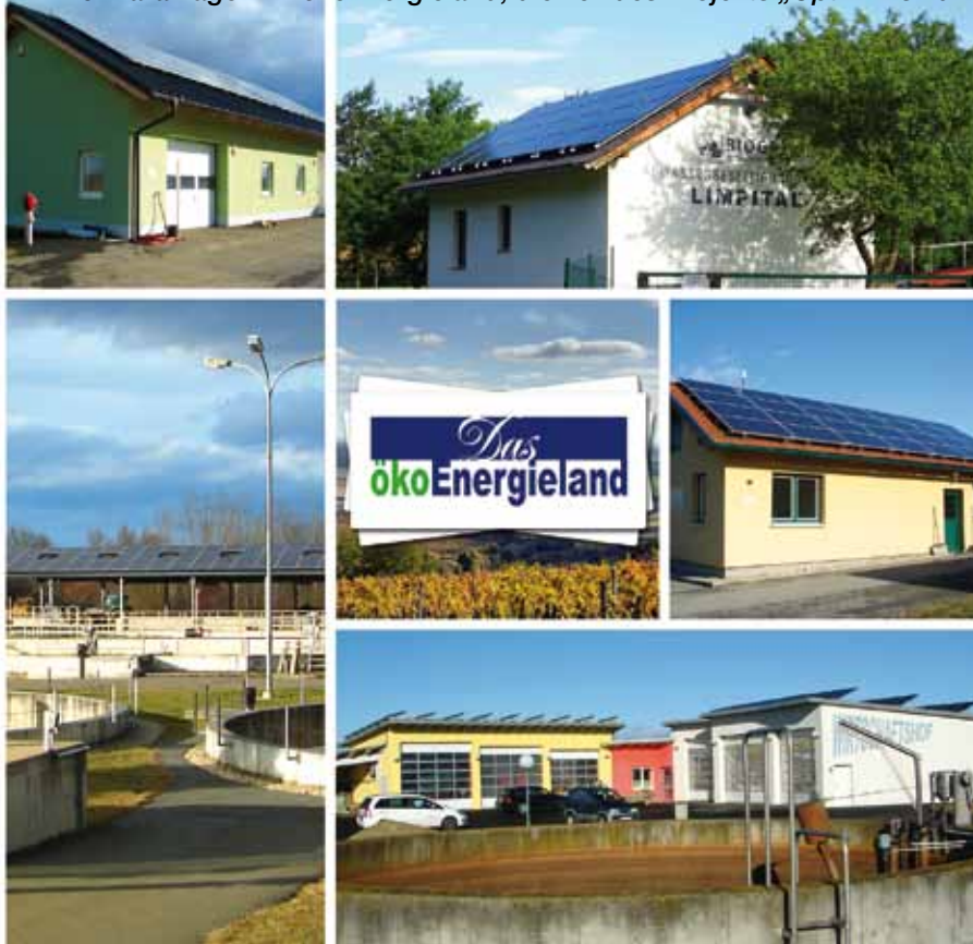
■ Die Kläranlagen im ökoEnergieLand, die Teil des Projekts „OptiPV“ sind.