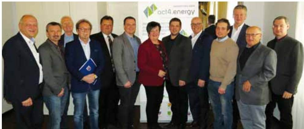
■ Die act4.energy-Verantwortlichen mit den GemeindevertreterInnen

„Im Innovationslabor werden neue, digitale Energiesysteme entwickelt und unter realen Bedingungen getestet, um den gewonnenen Photovoltaik-Strom auf kurzem Weg in die Steckdose und das Elektroauto zu bringen und so die Nutzungsmöglichkeiten von Erneuerbaren Energien wesentlich zu verbessern. Das bringt Stromkosten-Ersparnis, Investitionen, Arbeitsplätze, Tourismus-Impulse und vor allem auch eine große, neue, gemeinsame Aufgabe für