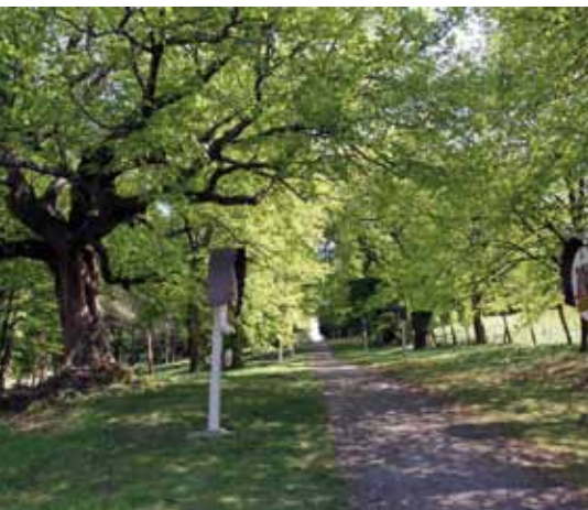
■ Lindenallee in Zillingtal (oben) und Blühfläche in Ollersdorf (unten)