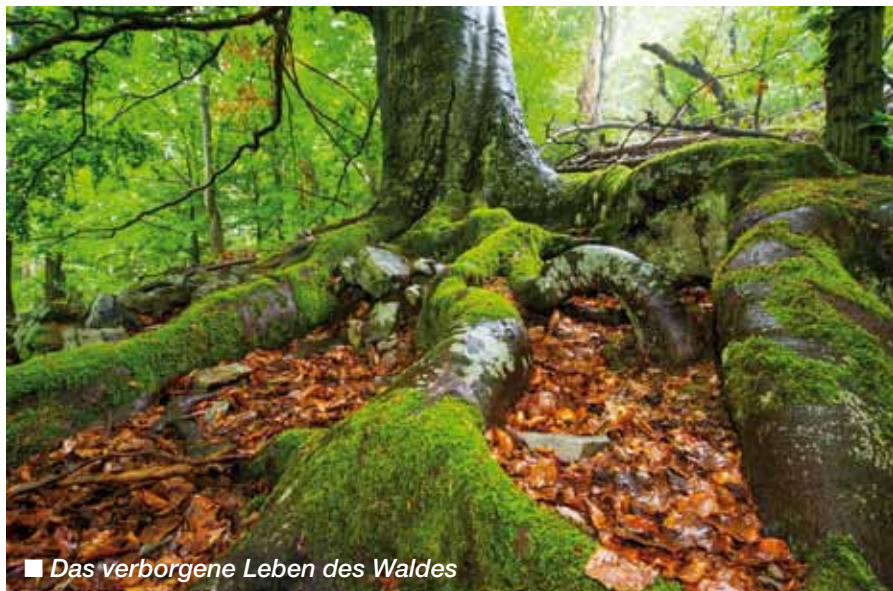
► Das verborgene Leben des Waldes

Anmeldung: 0699 180 859 75, astronomie-purerleben@gmx.at