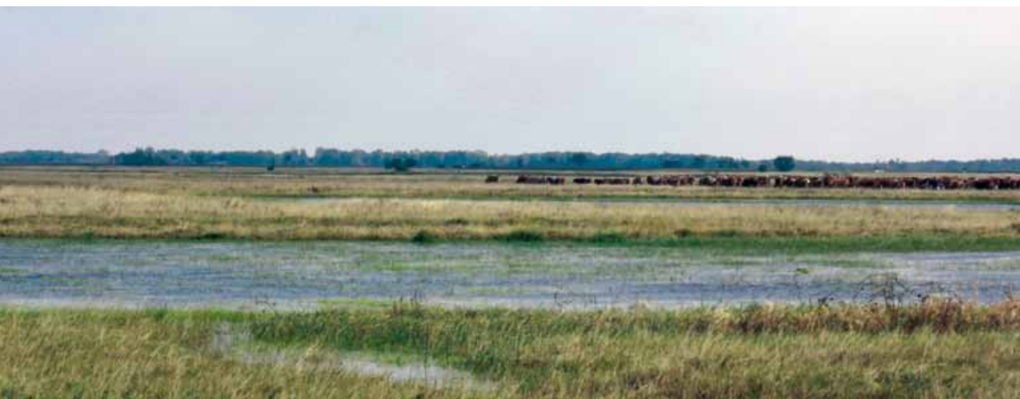
■ Landschaft am Neusiedler See als naturräumlich geprägte Kulturlandschaft

Gehen wir einen Schritt weiter und werfen österreichweit einen regions- und ortsbezogenen Blick auf den Raumbedarf des Menschen, ist festzustellen, dass die Landschaftsräume zwischen Stadt und Land zunehmend miteinander verschmelzen. Über die Bevölkerungsverteilung zeigt sich