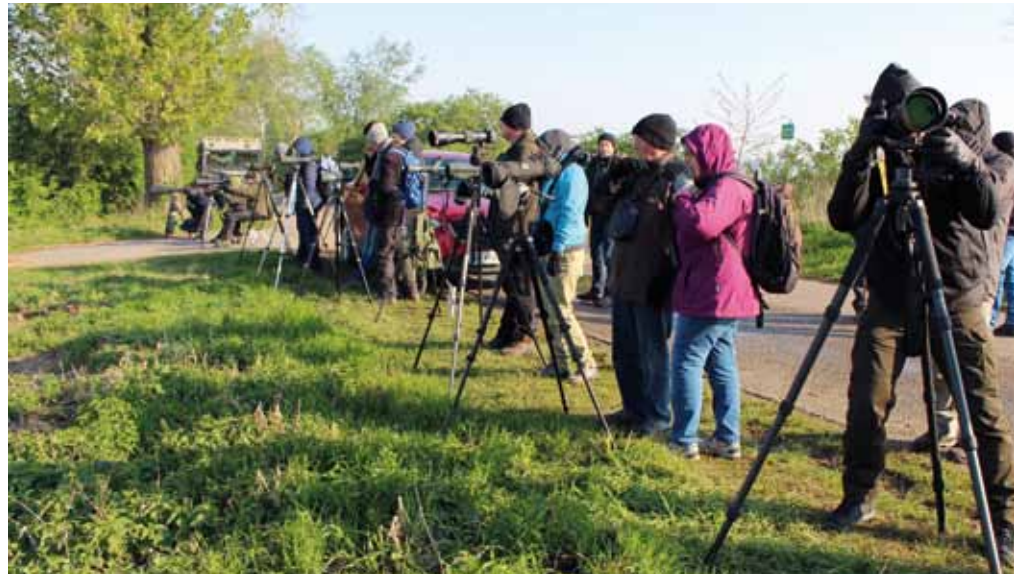
■ Exkursionen – hier ein Bild von jener zu den Großtrappen 2017 – zählen zu den Highlights jeder BEX.