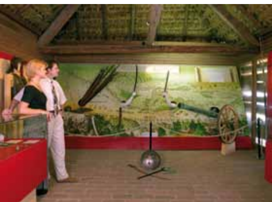
■ Schlösslberg (unten) und Museum (links) laden zum Besuch ein.

Dank des wirklich sehr guten Einvernehmens zwischen Kirche und Gemeinde konnte durch den Schlösslverein Mogersdorf rund um diese Gedenkstätte das historische Geschehen aufbereitet werden. Ein Museum (Gedenkraum) in einem alten Tabak trockenstadel zeigt die Ereignisse der Türken Schlacht auf eindrucksvolle Weise, eine alte Weinpresse und ein Kellerstöckl erinnern an den früheren Weinbau. Das moderne Restaurant mit gemütlicher Aussichtsterrasse lädt die Gäste ein, sich optisch und geistig in der reizvollen Landschaft mit sanft geschwungenen Wiesenflächen zu verlieren. In diesem entschleunigten Landschaftsteil lädt der Friedensweg zu gemütlichen Spaziergängen rund um den Schlösslberg und in die umliegenden Ortschaften. Der Schlösslberg ist Landschaftsschutzgebiet und ein Juwel des südlichsten Bezirks des Landes Burgenland.