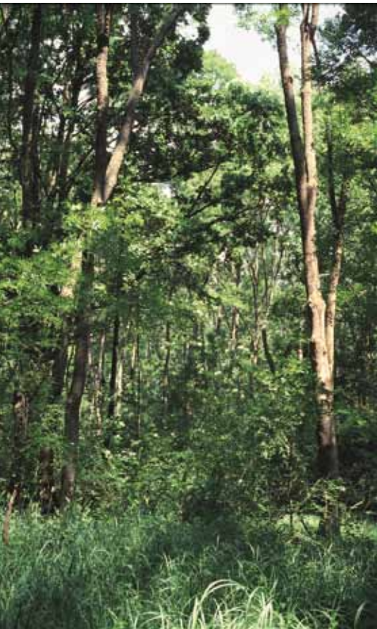
■ Auwald an der Unteren Strem bei Hagendorf.

Wesentliche Profiteure im Burgenland sind die naturschutzfachliche, wasserbauliche und forst-